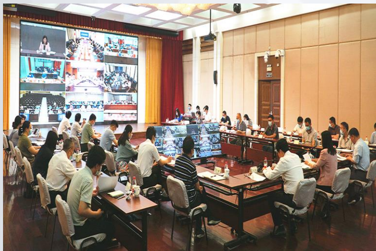
基层中医药服务能力提升工程 “十四五”行动计划启动视频会议